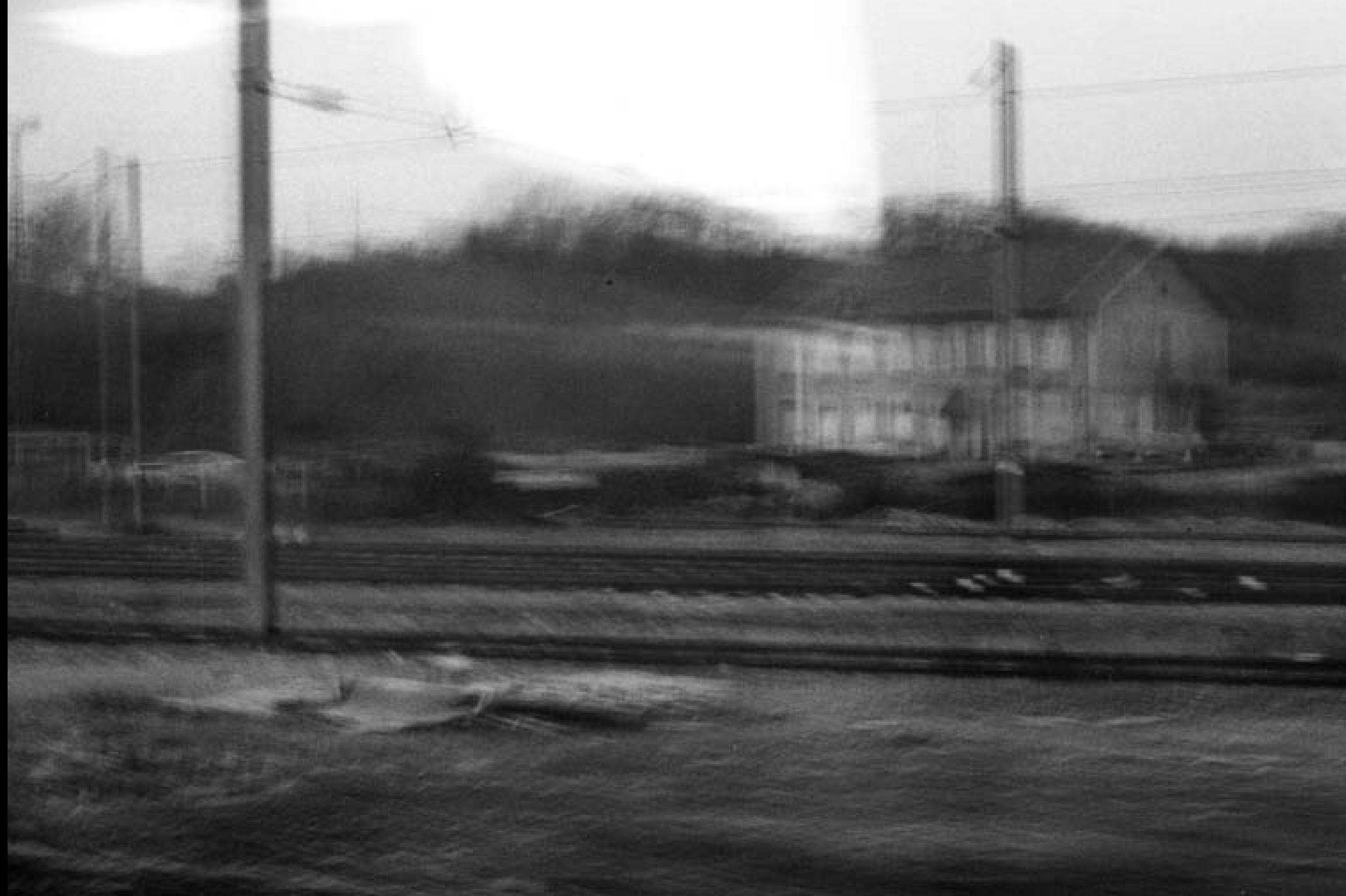
Chaque image a été prise au cours du trajet ferroviaire Châbons-Grenoble que j'ai emprunté pour aller au lycée.